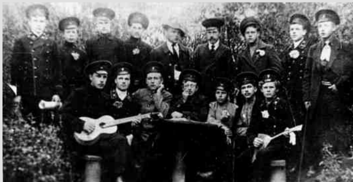
❖ Студенты БСХТ тогда