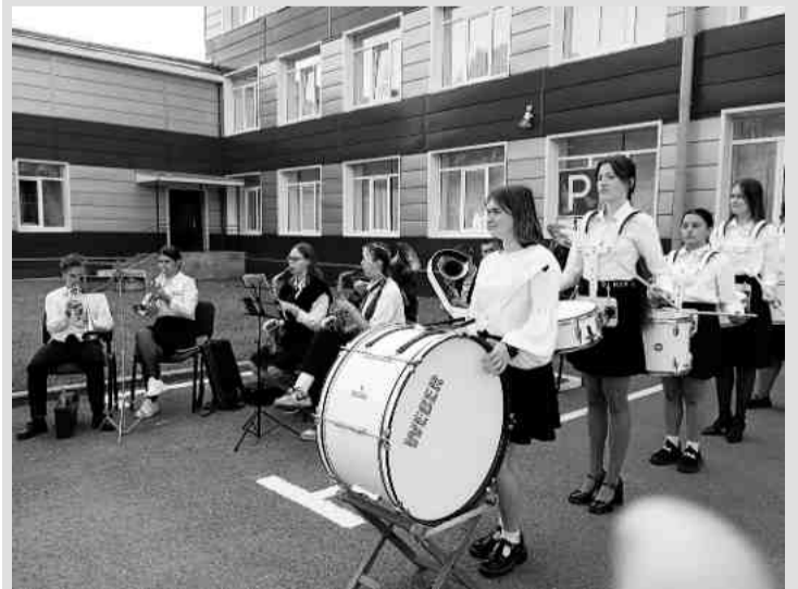
❖ Оркестр Беседского техникума