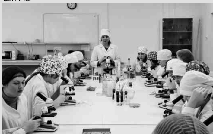
❖ Студенты БСХТ на занятиях