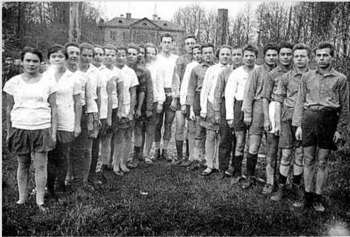
❖ Студенты на занятиях спортом