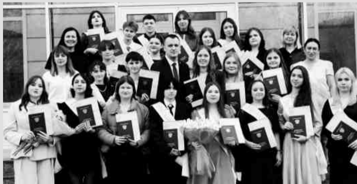
❖ Выпуск 2026 г. Специальность «Кинология»