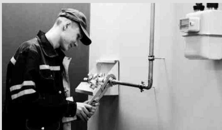
❖ Региональный чемпионат по компетенции «Монтаж и техническое обслуживание бытового газового оборудования»