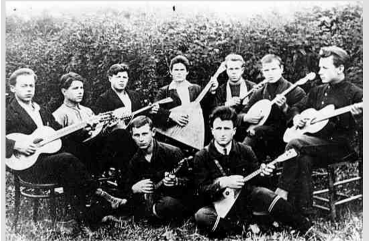
❖ Струнный оркестр Беседского техникума. 1920-е гг.