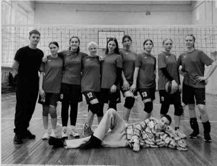
❖ Команда техникума по волейболу

4 июня 1921 года училище получило статус сельскохозяйственного техникума. Через три года состоялся первый выпуск агрономов. Конкурс в 1925 году — четыре человека на место. Техникум не только учил, но и просвещал крестьян: студенты выезжали в деревни с лекциями о прогрессивных методах обработки земли. Учебное хозяйство занимало почти 480 гектаров, на его ферме продуктивность достигала 4000 литров молока от коровы в год. Восьмипольный севооборот, внесение органики, урожай в 22–26 цент-